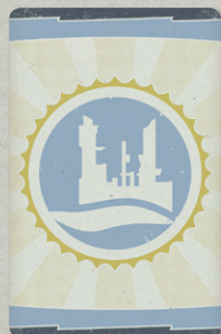
25 – в ПУСТОШИ