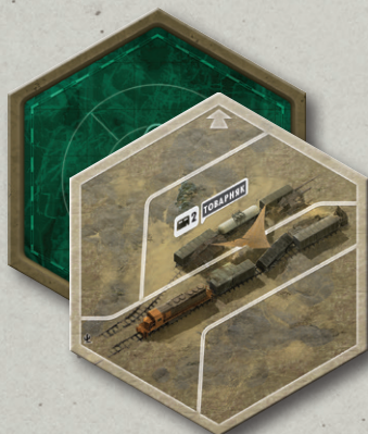
12 ФРАГМЕНТОВ ИГРОВОГО ПОЛЯ