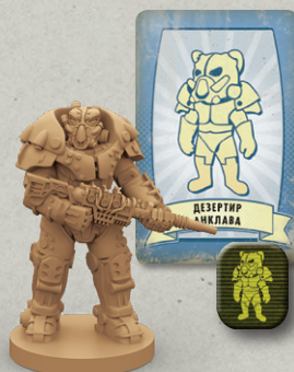
5 ПЛАСТИКОВЫХ ФИГУРОК 6 КАРТ ПЕРСОНАЖЕЙ 5 S.P.E.C.I.A.L.-ЖЕТОНОВ ПЕРСОНАЖЕЙ