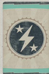
32 КАРТЫ ЗАДАНИЙ