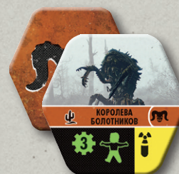
6 ЖЕТОНОВ ВРАГОВ