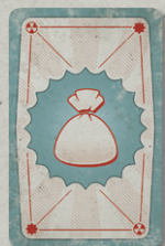
26 КАРТ ДОБЫЧИ