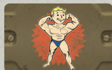
7 КАРТ ПРЕИМУЩЕСТВ