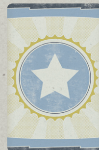
9 ОСОБЫХ КАРТ