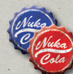
6 ЖЕТОНОВ КРЫШЕК