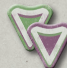
6 ЖЕТОНОВ ЗАДАНИЙ