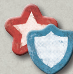
6 ЖЕТОНОВ ГРУППИРОВОК