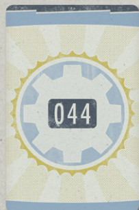
19 – в УБЕЖИЩЕ