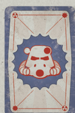
8 КАРТ УНИКАЛЬНЫХ АКТИВОВ