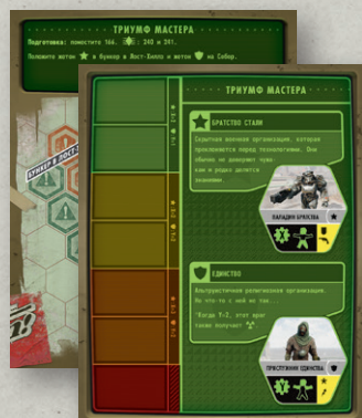
6 ЛИСТОВ СЦЕНАРИЕВ