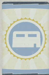
22 – в ПОСЕЛЕНИИ 66 КАРТ ВСТРЕЧ