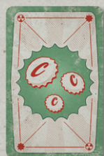
21 КАРТА АКТИВОВ