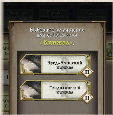
При показателе сведений «25» игрок может улучшить «Кинжал» до «Эред-Луинского кинжала» или до «Гондолинского кинжала»

Если вы выберете подсвеченное снаряжение в меню, приложение укажет на его возможные улучшения. Чтобы улучшить снаряжение, игроку нужно выбрать его улучшенную версию в приложении, а затем вернуть в запас улучшаемую карту снаряжения и взять вместо неё улучшенную.