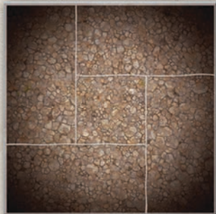
Фрагмент поля для битвы

Когда партия проходит на поле для битвы, все основные правила игры остаются неизменными. Однако в такой партии будут появляться жетоны местности, которые влияют на правила перемещения и атаки.