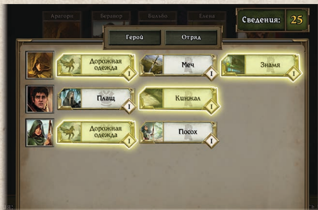
У героев достаточно сведений для улучшения всего подсвеченного снаряжения

Если вы выберете подсвеченное снаряжение в меню, приложение укажет на его возможные улучшения. Чтобы улучшить снаряжение, игроку нужно выбрать его улучшенную версию в приложении, а затем вернуть в запас улучшаемую карту снаряжения и взять вместо неё улучшенную.