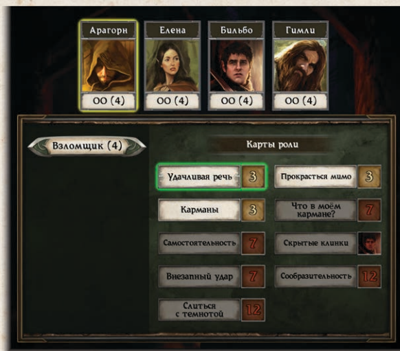
Арагорн взял роль взломщика и получил 4 очка опыта в этой роли. У него уже есть «Удачливая речь», поэтому он может приобрести либо карту «Прокрасться мимо», либо карту «Карманы» из доступных взломщику карт

Игрок может выбрать в приложении своего героя, чтобы открыть меню, в котором будут отражены накопленные им очки опыта по каждой роли. Выбрав роль, игрок перейдёт к списку всех относящихся к этой роли карт, среди которых зелёным будут выделены карты навыков, уже находящиеся в колоде героя, а красным — карты, для приобретения которых у героя недостаточно опыта. Карты навыков, недоступные герою по причине того, что они уже взяты другими героями, также выделены красным и содержат портрет этого героя.