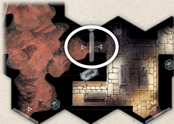
Эти две области считаются смежными, поскольку их серые границы складываются в одну линию (границу с двумя стрелками)

Если две области разделены чёрной границей, а их серые границы не складываются в одну линию (т. е. если серая граница складывается с чёрной), эти области не считаются смежными.