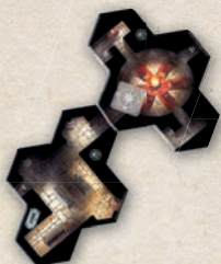
Фрагмент поля для странствий

В некоторых приключениях вместо обычных фрагментов поля для странствий используются фрагменты поля для битвы. Поле для битвы используется, когда приключение сосредоточено на стратегически важном моменте игры, а не на путешествии и исследовании.