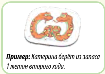
Пример: Катерина берёт из запаса 1 жетон второго хода.

Возьмите 1 жетон второго хода из запаса. Если таких жетонов в запасе нет, все игроки должны вернуть свои жетоны второго хода в запас, а затем вы берёте 1 жетон себе. Вы не можете использовать жетон второго хода в тот же ход, в который получили его. После использования жетон сразу возвращается в запас.