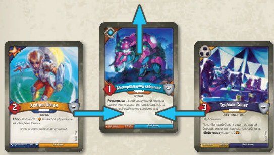
Существо из центра боевой линии покидает игру, и боевую линию смыкают

Когда существо покидает игру, сомкните боевую линию так, чтобы в ней не было пробелов.