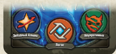
Три дома указаны на карте архонта

В каждой колоде KeyForge присутствуют 3 дома, чьи гербы изображены на карте архонта. На этом этапе активный игрок выбирает один из трёх домов, и этот дом становится активным до конца хода. Активный дом определяет, какие карты игрок может разыграть, сбросить с руки или использовать на этом ходу.