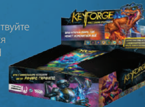
Дисплей «Массовая мутация»