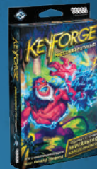
Уникальная колода «Массовая мутация»

Если вы готовы к соревновательной игре, участвуйте в турнирах и чемпионатах, которые проводятся при поддержке Fantasy Flight Games Organized Play. Ищите нас на сайте KeyForgeGame.com .