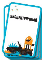
150 КАРТ ПРИЛАГАТЕЛЬНЫХ