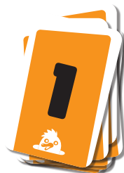
8 КАРТ С ЦИФРАМИ