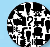
Фальшивые деньги выглядят вот так! Г-н Монополии в маске!

Если проверяемая карточка окажется настоящей, игрок, вытаснувший карточку, сможет ею воспользоваться. С вами ничего не происходит.