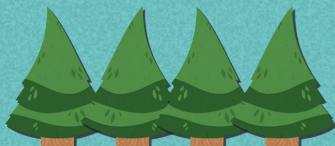
4 × пустых дерева