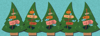
5 × указателей

Тот, кто последним ел пирожки, начинает раунд. Игрок, который проиграет, начнёт следующий раунд.