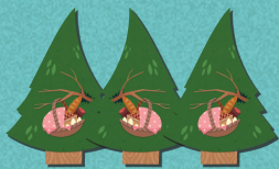
3 × корзины