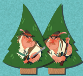
2 × охотника