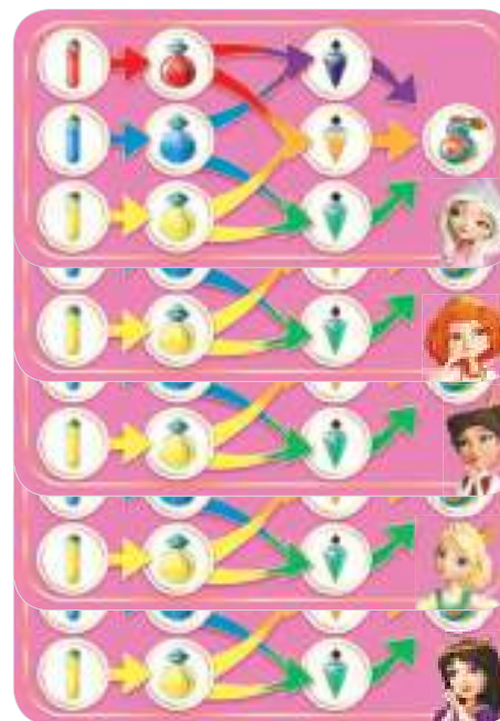
Планшеты игроков – 5 шт.