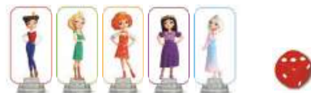
Фишки царевен – 5 шт.