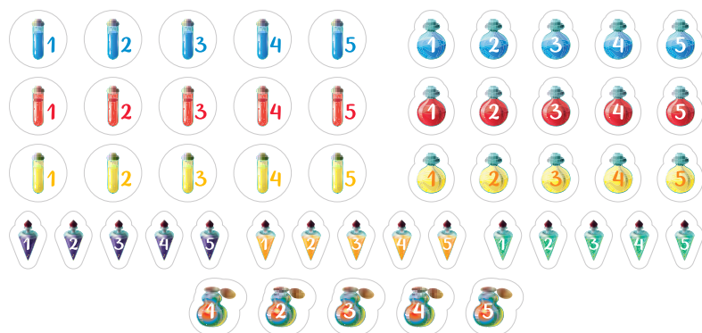
Жетоны зелей и ингредиентов – 50 шт.