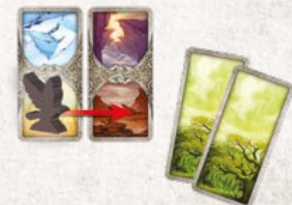
Игрок использует 2 карточки Леса, чтобы переместить своего ворона на одну локацию Гор.

Если у игрока нет карточек полета, которые совпадают с ландшафтом в локациях перед его вороном, он может использовать две любые одинаковые карточки полета так, как будто это нужная ему для перемещения карточка. Игроки складывают свои сыгранные карточки полета на столе лицом вверх в стопку сброса. Если стопка карточек полета закончится, игрок перетасовывает свою стопку сброса и формирует из нее новую стопку карточек полета.