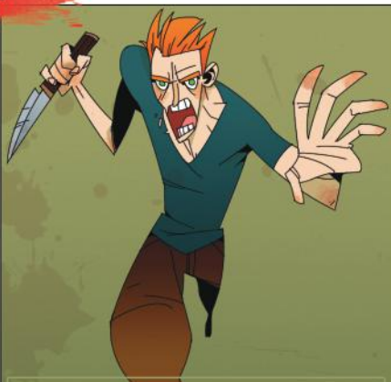
РОБЕРТ, ЗОМБИ (ИЛИ НЕ ЗОМБИ)

ВЫ ЕЩЁ МОЖЕТЕ СБЕЖАТЬ В 367, НО ЭТО БУДЕТ СТОИТЬ ВАМ 4 ОЗ. ОЗ: 12 НОЖ: 4 УР ПОБЕДА → 175