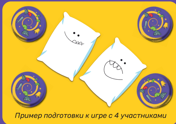
Пример подготовки к игре с 4 участниками