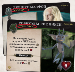
Карта существа «Корнуэльские пикси» входит в состав дополнения «Чудовищная коробка чудищ».