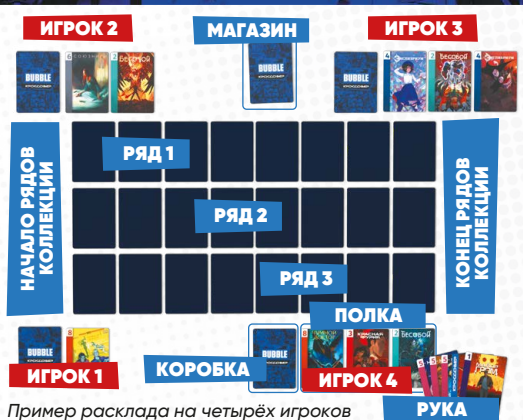
Пример расклада на четырёх игроков

Если у вас не осталось карт на руке, выложите на свою полку ещё одну карту из коробки (в таком случае у вас на полке может оказаться более трёх карт). После этого вы можете продолжить ход. Если игрок больше не может или не хочет выкладывать карты и разыгрывать комбинации, он добирает на руку 5 карт из магазина и пополняет свою полку до трёх карт из своей коробки. На этом его ход заканчивается и переходит к следующему игроку по часовой стрелке.