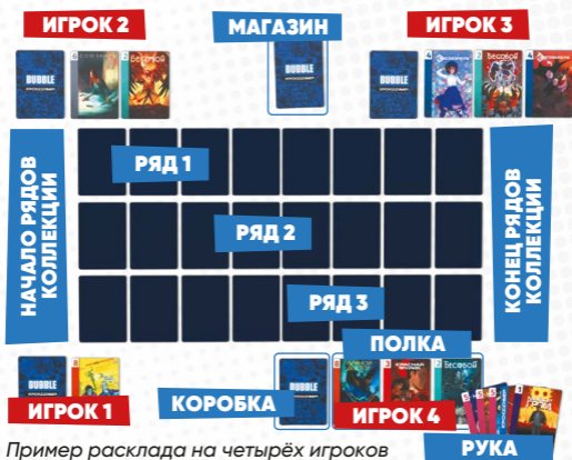
Пример расклада на четырёх игроков