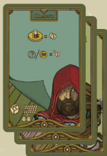
36 альтернативных карт действий