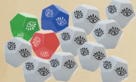
12 ДВЕНАДЦАТИГРАННЫХ КУБИКОВ (3 ЦВЕТНЫХ + 9 БЕЛЫХ БОНУСНЫХ)