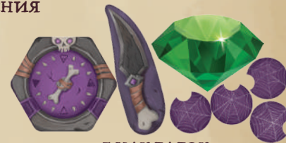
7 НАКЛАДОК (1 КОМПАС, 1 НОЖ В СПИНУ, 1 СОКРОВИЩЕ, 4 ПАУТИНЫ)