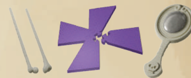
2 КОСТЯНЫЕ ПАЛОЧКИ, 1 СТЕНД ЛЕВИТАЦИИ, 1 ЛОРНЕТ ДУХОВИДЦА