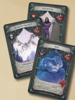
3 КАРТЫ БОССОВ