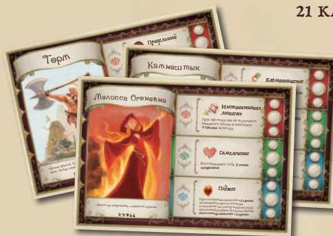
4 ПЛАНШЕТА ГЕРОЕВ