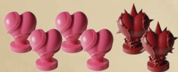
4 ФИШКИ ЗДОРОВЬЯ ГЕРОЕВ 2 ФИШКИ ЗДОРОВЬЯ МОНСТРА