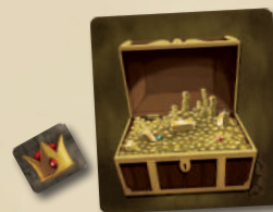
ЖЕТОН ВОЖАКА ЖЕТОН СУНДУКА