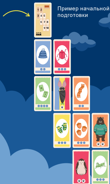
Пример начальной подготовки

Сложите карту животного и карты предметов, запасенных вместе с ним, стопкой лицевой стороной вниз, а стопку положите рядом с другими своими картами.