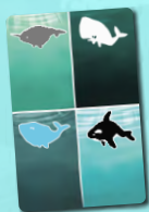
Карта козырного кита