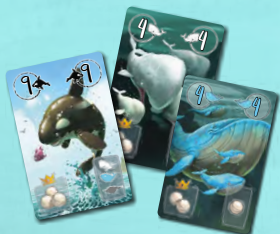
36 карт китов