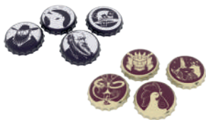
8 крышек (4 синих и 4 бежевых)