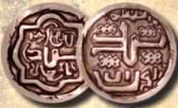
МЕДНАЯ ДЕНЬГА Монета номиналом 1