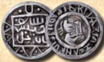
СЕРЕБРЯНАЯ ДЕНЬГА Монета номиналом 3