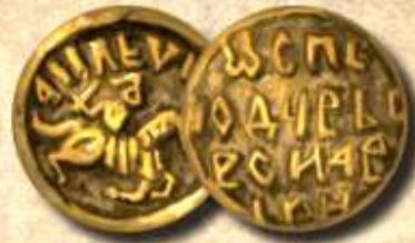
ЗОЛОТАЯ ДЕНЬГА Монета номиналом 5