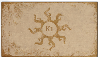
1 конверт миссии