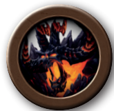
1 жетон активации