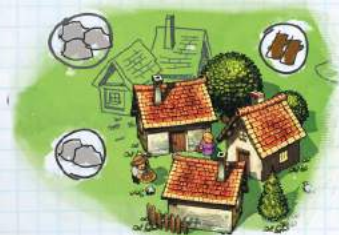
Поле с 3 клетками для Сбора Ресурсов

Игрок тратит одно из своих доступных действий, зачеркивает одну клетку в своих Владениях (○) и получает ресурсы, указанные внутри этой клетки. Игрок должен сначала получить доступ к выбранному Владению в своей империи. В начале игры все Владения недоступны.