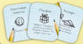
(3 жетона Благ при игре вдвоем)