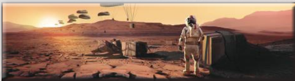
«Поставка снабжения» (Гарретт Каида)

Этот вариант игры можно использовать с любыми дополнениями. Теперь, вместо того, чтобы увеличивать глобальные параметры, ваша цель — повысить свой РТ до 63 за 14 поколений (или за 12, если вы играете с картами прологов). Пометьте 63-е деление золотым кубиком. В этом варианте игры добавляется новый стандартный проект «Буферный газ», который стоит 16 М€ и повышает ваш РТ на 1. В остальном действуют обычные правила игры в одиночку.