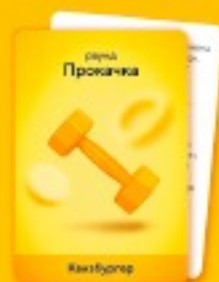
100 карточек для раунда «Прокачка»