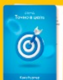
50 карточек для раунда «Точно в цель»