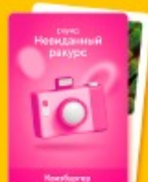
10 карточек для раунда «Невиданный ракурс»