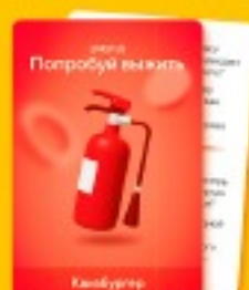
59 карточек для раунда «Попробуй выжить»