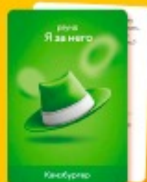
50 карточек для раунда «Я за него»