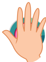
игрок 1 активный игрок

Поверните жетон нужной цифрой вверх и накройте его ладонью. Когда все проголосовали, на счёт «три» одновременно раскройте ответы.