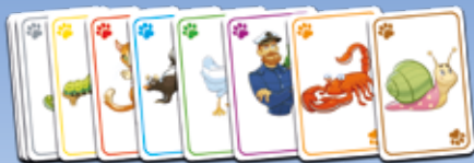
92 vaidinimo kortelės