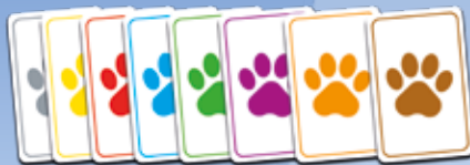
8 loterijos kortelės