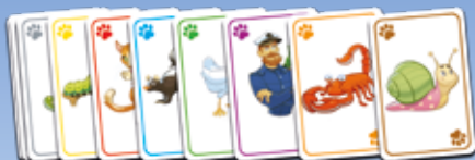
92 рольові акторські картки