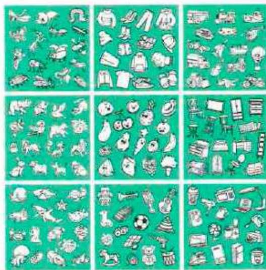
Игровые поля для начинающих