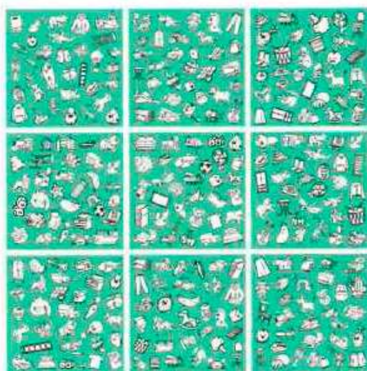
Игровые поля для опытных игроков