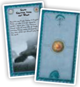
Свободные народы (20)