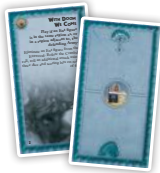
Свободные народы (6)