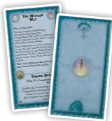
Свободные народы (6)