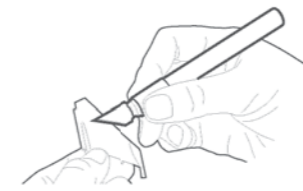
Нож цапговый кат. №1103